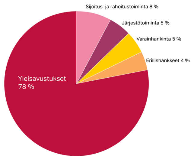
Suomen Taiteilijaseuran menot 2017