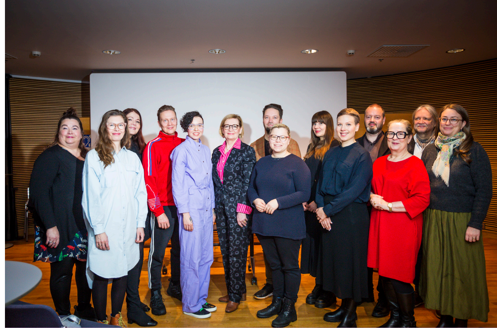
Kuvataidekummit-verkoston lanseeraustilaisuus järjestettiin joulukuussa 2022 eduskunnan Pikkuparlamentin Kansalaisinfossa. Kuvassa kansanedustajia ja kuvataidekummeja.

Seuran edustajat yhdessä Frame Contemporary Art Finlandin ja Kuvaston kanssa tapasivat myös tiede- ja kulttuuriministeri Petri Honkosta syyskuussa aiheena kuvataiteen julkinen rahoitus.